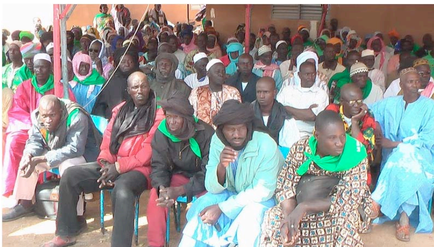
Paysans et éleveurs au Forum du Kolongo réclament une suspension des investissements étrangers dans l'Office du Niger

M.Guèye a expliqué cependant que les investisseurs saoudiens se sont depuis retirés du projet, prétextant des problèmes financiers, et que le gouvernement du Sénégal est aujourd'hui à la recherche de nouveaux investisseurs pour mener à bien le projet.