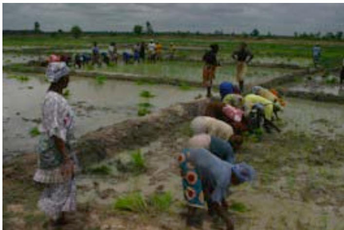
Producteurs de riz dans la vallée du fleuve Sénégal

environ la moitié se trouvent actuellement cultivés sous irrigation. Ces terres, dont la plupart sont travaillées par des familles qui ont accès à moins d'un hectare, produisent 70 % de la récolte de riz nationale ; on estime qu'elles constituent le moyen de subsistance de 600 000 personnes. Mais cette région est aussi d'une importance vitale pour les éleveurs et pour la production de sorgho, qui ont tendance à être en concurrence directe avec l'expansion de l'irrigation.