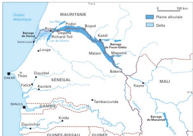
Carte 2. Vallée du Fleuve Sénégal

L'argument "gagnant-gagnant" dans le cas de ce projet est difficile à discerner, mais la proposition essaie d'en dégager un : elle prétend que le projet va d'une façon ou d'une autre contribuer à l'autosuffisance en riz du Sénégal et fournir des emplois aux paysans qui ne pourront plus cultiver leurs terres. « La main-d'œuvre productive sera exclusivement locale, afin d'améliorer les conditions de vie et de dégager ainsi des options de développement économique et social, » peut-on lire dans la proposition. Quant aux