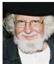
Ernesto Cardenal , nicaraguanischer Dichter, Mitglied im INKOTA-Beirat

... INKOTA nicht nur im Süden handelt, sondern auch die Verantwortung der Industrienationen des Nordens für die Situation der Länder des Südens sieht und aus dieser Einsicht heraus im Norden aktiv ist. Das sehe ich mit ausgesprochen großer Freude.