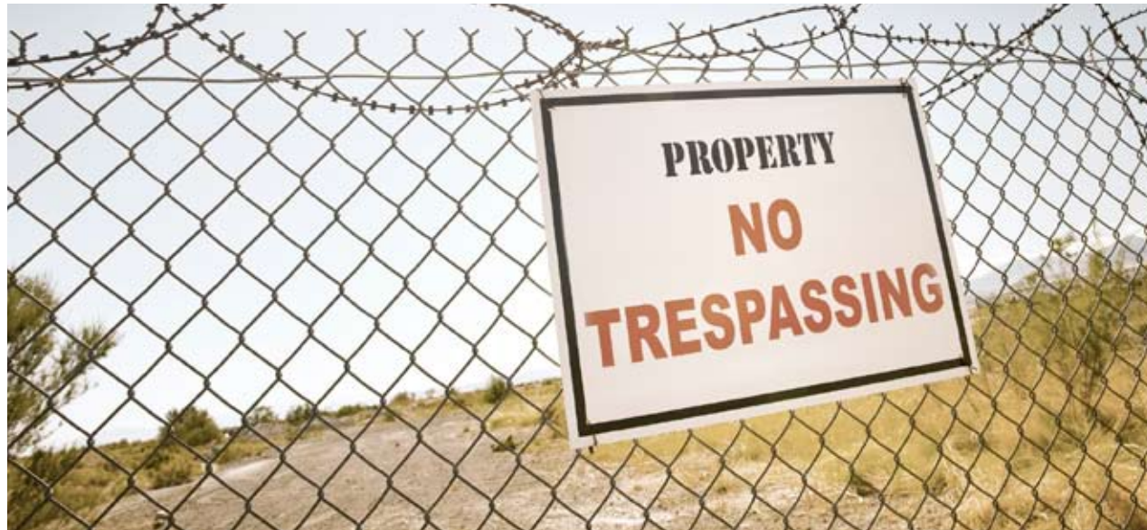
Wenn das Land an ausländische Investoren verkauft ist, finden sich Kleinbauern, Hirten und Nomaden vor meterhohen Zäunen wieder. Der lebensnotwendige Zugang zu Acker- und Weideland bleibt ihnen verschlossen.

Mosambik Millionen Hektar Ackerland im Visier von Investoren aus aller Welt