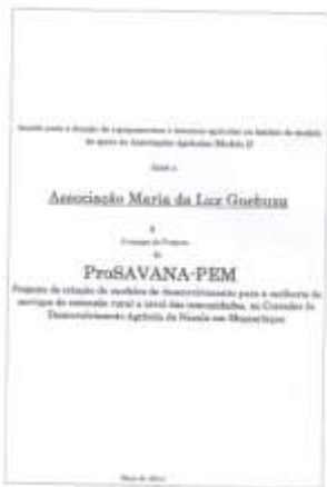
[左] 契約書表紙。訳：2014 年 5 月付、PEM モデル 2「アソシエーションによる農業支援モデル」のための農業資機材・投入財の寄贈契約 PEM チームと「マリア・ダ・ルス・ゲブーザ・アソシエーション」（リバブエ郡イアパラ地区） [下] 現地 NGO が調査中に遭遇した PEM 担当日本人専門家